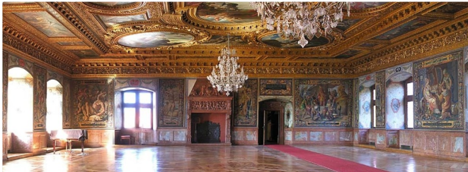
Schloss Ratibor Prunksaal

Das Wahrzeichen und Schmuckstück der Stadt Roth ist das Schloss Ratibor. Das zwischen 1535 und 1538 von Markgraf Georg dem Frommen errichtete repräsentative Jagdschloss wurde von den Einkünften des Regenten aus seinen schlesischen Besitzungen finanziert. Er nannte es deshalb „Schloss Ratibor an der Retzet“. Hauptattraktion und größter Raum des Schlosses ist der Prunksaal. In seiner Gestaltung erinnert er an italienische Säle der Spätrenaissance. In weiteren Räumen befindet sich das Stadtmuseum.