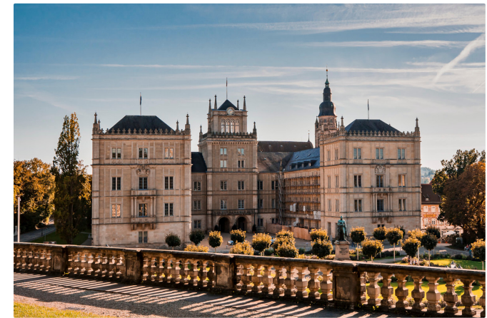
Schloss Ehrenburg