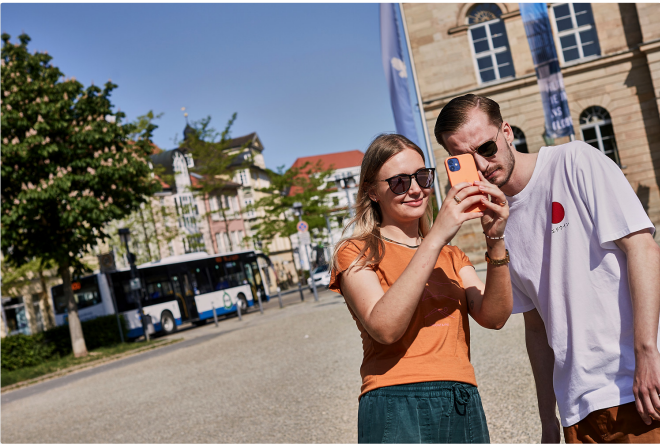
Stadttour in Coburg

Jetzt wird es grün! Durch den malerischen Hofgarten kommen wir zur Veste Coburg . Für einen entspannten Tagesausklang eignet sich besonders der Hofgarten mit Blick auf die Stadt – oder eines der zahlreichen Restaurants in der Altstadt. Vom Bahnhof gelangen wir z. B. umsteigefrei mit den Regionalbahnen RE 19 , RE 28 oder RE 29 in etwa einer Stunde zurück nach Nürnberg.