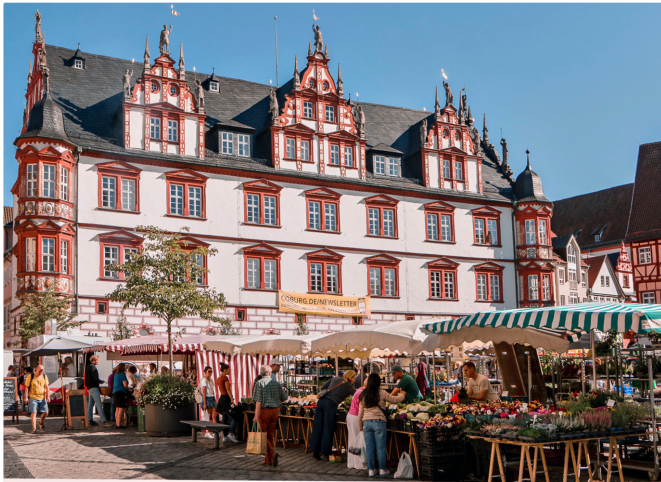
Coburger Wochenmarkt

Hier entdecken wir bereits die ersten Sehenswürdigkeiten: Die Spitalgasse und der Steinweg sind bekannte Einkaufsstraßen in der historischen Altstadt von Coburg. Diese Straßen sind mit die ältesten Straßen in Coburg und wurden bereits im Mittelalter als Handelsstraßen genutzt. Heute sind hier viele Geschäfte, Cafés und Restaurants zu finden. Besonders sehenswert sind die mehrere hundert Jahre alten Gebäude, die aufwändig restauriert wurden. Sobald man den Marktplatz betritt, fällt direkt das imposante Rathaus ins Auge. Wer genau hinschaut, entdeckt auf dem Giebel das Bratwurstmännchen, welches in seiner rechten Hand das Bratwurstmaß präsentiert. So sagt es zumindest die Legende. Tatsächlich handelt es sich bei der Figur um den Coburger Stadtpatron Mauritius, der den Marschallstab als Zeichen seiner Macht emporstreckt. Nichtsdestotrotz gilt der Stab als Maßeinheit für die korrekte Länge der original Coburger Bratwurst. Diese beträgt genau 31 Zentimeter im Rohzustand. Traditionell wird die Wurst auf einem Rost über Kiefernzapfen gebraten und zum Beispiel in einem aufgeschnittenen Weckla gegessen.