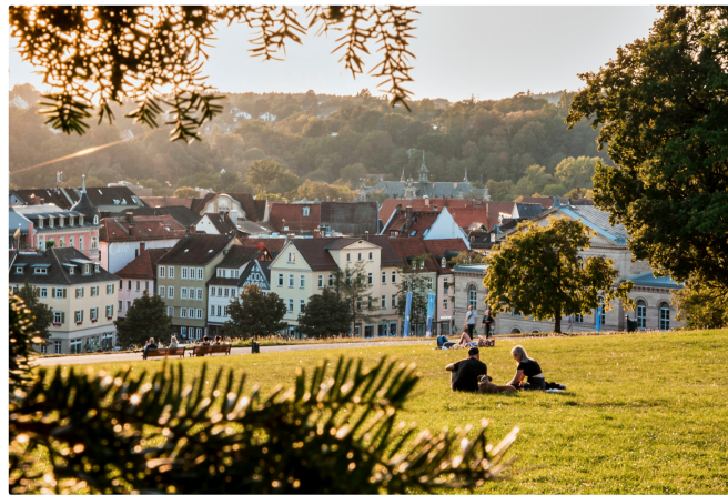
Stadtblick Coburg

Weitere kulinarische Köstlichkeiten sind die Coburger Schmätzchen, eine Art Lebkuchen, und der Coburger Rutscher, ein Kartoffelkloß mit sehr weicher Konsistenz, sowie der Hof-Likör.