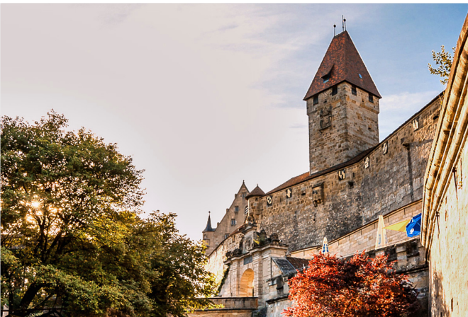
Burgansicht Coburg

Jetzt wird es grün! Durch den malerischen Hofgarten kommen wir zur Veste Coburg . Für einen entspannten Tagesausklang eignet sich besonders der Hofgarten mit Blick auf die Stadt – oder eines der zahlreichen Restaurants in der Altstadt. Vom Bahnhof gelangen wir z. B. umsteigefrei mit den Regionalbahnen RE 19 , RE 28 oder RE 29 in etwa einer Stunde zurück nach Nürnberg.